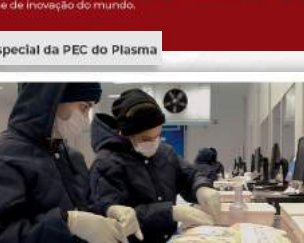
Ministra da Saúde, Nísia Trindade, e a ministra de Ciência, Tecnologia, Inovação e Comunicação, Luciana Santos, durante a visita à Hemobrás, visando a fortalecer a cadeia de produtos, artigos e insumos para o SUS.